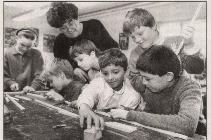
Serények a kisdíjak, fűgőn dolgoznak a technikaórára